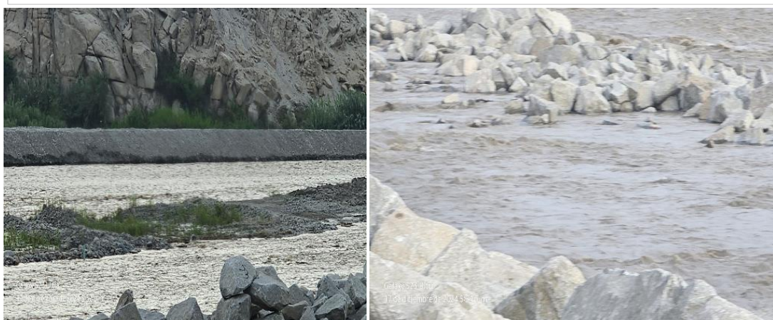
FOTOGRAFIA 02: Vista en la que se aprecia la carencia de diques secos con acumulacion de material propio en ambas margenes del RIO CHICO.