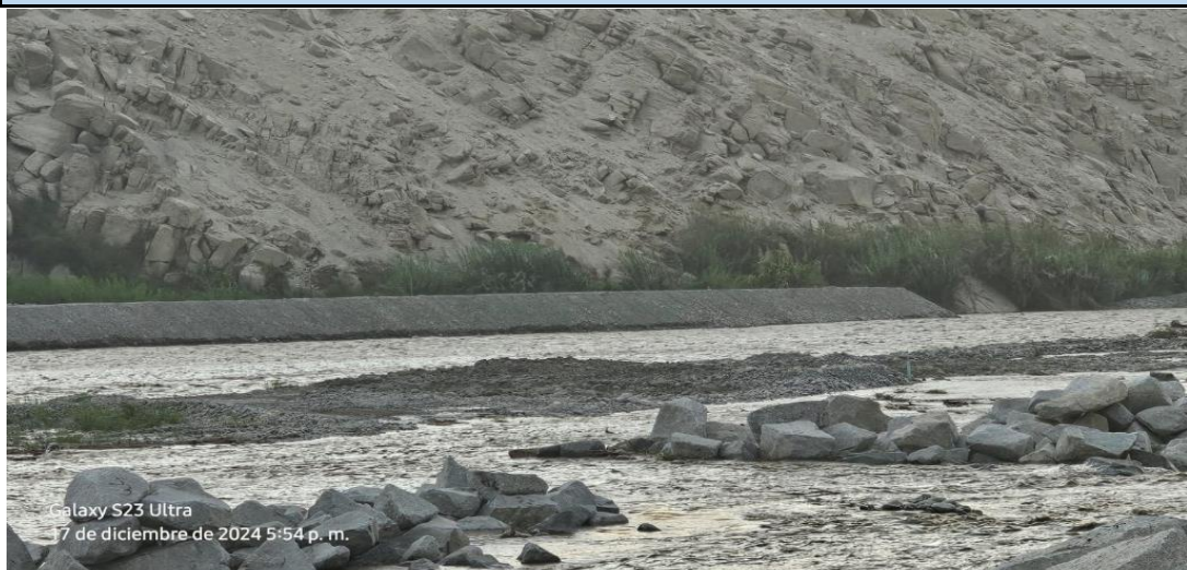
FOTOGRAFIA 01: Vista en la que se aprecia el cauce de la quebrada, la cual se encuentra colmatada, producto de las máximas avenidas.